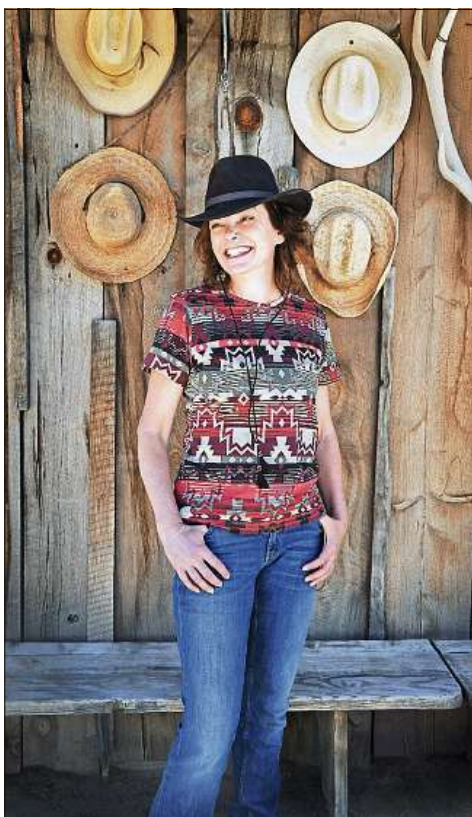
Milena Moser, eine der erfolgreichsten Schweizer Buchautorinnen, kommt nach Glarus.

eing. Milena Moser träumt von der Freiheit und sehnt sich nach der grossen Liebe. Um das zu finden, lässt sie alles hinter sich und wandert in die USA aus. Nach ihrem Bestseller «Das Glück sieht immer anders aus» erzählt Moser von ihren Erlebnissen in Amerika und verrät, wo das Glück zu finden ist. Als de-Cesco-Leseratte träumte Milena Moser vom Wilden Westen. Pferd und Indianerhäuptling standen oben auf ihrer Traumwunschliste. Als sie sich im Alter von 50 Jahren in Santa Fe ein winziges Häuschen kauft und beschliesst, ganz und gar dorthin auszuwandern, hat sie natürlich andere Träume im Kopf. Die Liebe will sie immer noch finden, die Freiheit sowieso. Aber erst muss sie lernen, wie man Dinge los wird, an denen das Herz hängt, wie man sich von Freunden und Kindern zu lösen lernt, wie es sich anfühlt, in einem fremden Land die Fremde zu sein. Sie beginnt wieder zu reiten. Sie lernt einen alten Freund näher kennen, der sich als Indianer entpuppt. Herz und Nieren sind nicht mehr die eines jungen Häuptlings, aber er ist tapfer und unbekümmert, und das lässt Milena schwach werden.