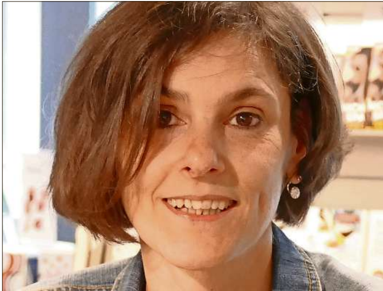
Beatrix Künzli hat ein Buch mit zauberhaften Winterbildern geschaffen: «Benjamins und Anastasias Abenteuer im Schnee».

Endlich ist der erste grosse Schnee im Glarnerland angekommen! Und genau passend dazu erscheint dieser Tage im Baeschlin Verlag ein neues Kinderbuch.